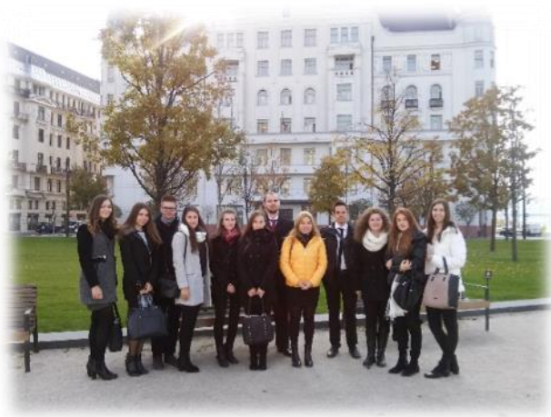
Csoportkép a Miskolci Jogi Kar jogászösztöndíjasairól az IM Nemzeti Kiválósági Jogászösztöndíjasok Szakmai Napján (2017. november 6.)

A Miskolci Jogi Kar IM Kiválósági Jogászösztöndíjas hallgatói így részt vehettek az IM által szervezett szakmai programokon, az IM Nemzeti Kiválósági Jogászösztöndíjasok Szakmai Napján (2017. november 6.), valamint Nemzeti Kiválósági Jogászösztöndíjasok Találkozásán (2018. február 12.).