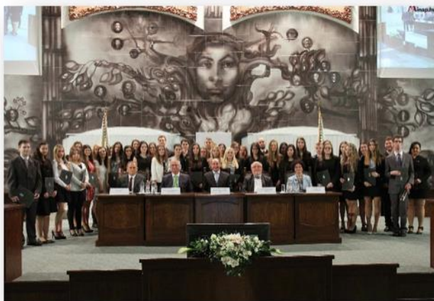
Csoportkép az IM Nemzeti Kiválósági Ösztöndíjasok oklevelének ünnepélyes átadásáról (2016. április 14.).

A félévente elnyerhető juttatás az első évfolyam első félévétől kezdve, 5 hónapon keresztül havi 60.000 Ft összegű ösztöndíj formájában kerül kiutalásra ( 300.000 Ft/félév ), amely fedezheti az önköltséget, sőt még marad is belőle.