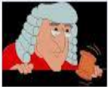
Lord Atkin House of Lords