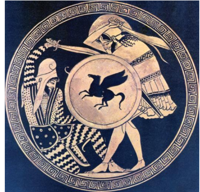
Görög-perzsa párharc ábrázolása egy görög vázán (Kr. e. 5 sz.)