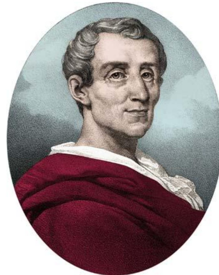
Charles-Louis de Secondat (Montesquieu bárója)