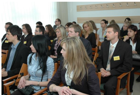
A versenyre jelentkezett csapatok és felkészítőik a verseny megnyitóján: május 5-én a Fialat jogászok szekciójában (balra), május 6-án pedig a Joghallgatók szekciójában (jobbra)