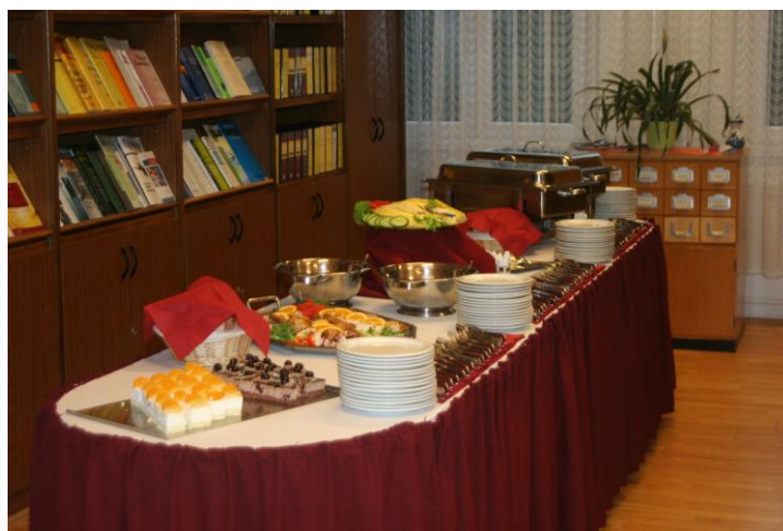
A verseny eredményhirdetését követő állófogadás