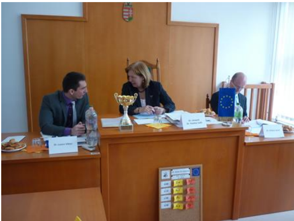
A Bíróság tagjai munka közben

A verseny alapjául szolgáló hipotetikus jogesetet – immáron mondhatni hagyományosan – idén is az Európai Unió Bíróságán dolgozó magyar tisztviselők írták meg. Ennek megfelelően az idei jogeset is igazán aktuális és összetett uniós jogi problémákra irányult. Sőt, az idei jogeset alapján – a korábbi hat Miskolci EU Vándorkupával szemben, ahol is előzetes döntéshozatali eljárásban kellett a csapatoknak a jogi érvelésüket előadni – a csapatoknak a Törvényszék egyik – szintén az idei jogeset megírói által kitalált, hipotetikus – ítélete ellen kellett fellebbezni a Bíróságra.