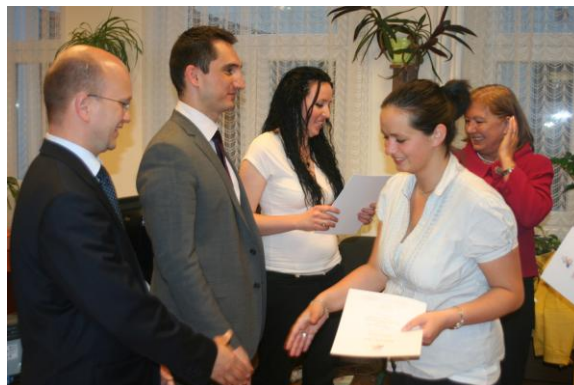
Eredményhirdetés május 6-án a Joghallgatók szekciójában