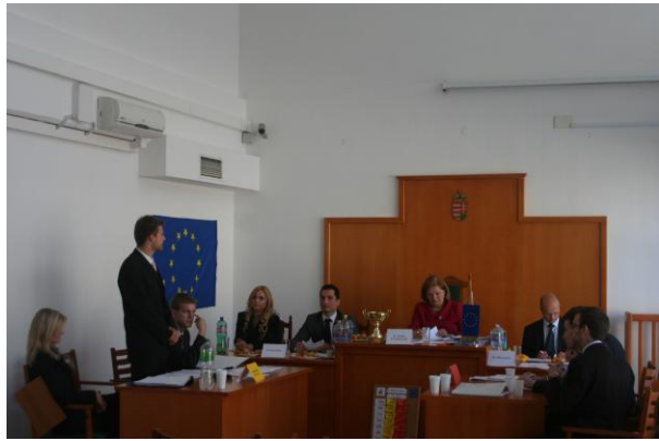
Verseny közben: a Fiatal jogászok szekciójának (balra) és a Joghallgatók szekciójának (jobbra) csapatai

A verseny alapjául szolgáló hipotetikus jogesetet – immáron mondhatni hagyományosan – idén is az Európai Unió Bíróságán dolgozó magyar tisztviselők írták meg. Ennek megfelelően az idei jogeset is igazán aktuális és összetett uniós jogi problémákra irányult. Sőt, az idei jogeset alapján – a korábbi hat Miskolci EU Vándorkupával szemben, ahol is előzetes döntéshozatali eljárásban kellett a csapatoknak a jogi érvelésüket előadni – a csapatoknak a Törvényszék egyik – szintén az idei jogeset megírói által kitalált, hipotetikus – ítélete ellen kellett fellebbezni a Bíróságra.